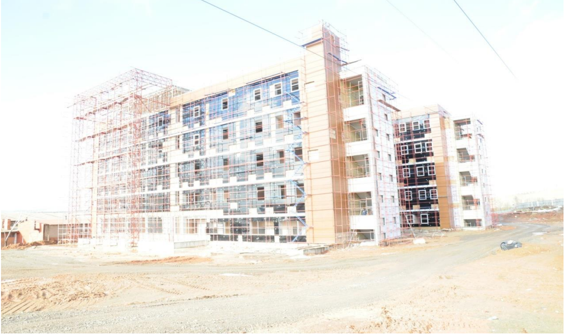
Dış Hekimliği Fakültesi

olmak üzere toplam 12.900.000,00 TL ödenek ilave edilmesiyle projenin yılsonu toplam ödeneđi 25.900.000,00 TL olmuştur. Yılsonu itibariyle 24.898.561,25 TL harcama yapılarak Derslikler ve Merkezi Birimler Veteriner Fakültesi 2. Kısım İnşaatı %60, Dış Hekimliği Fakülte binası inşaatı %50 seviyesine gelmiştir.