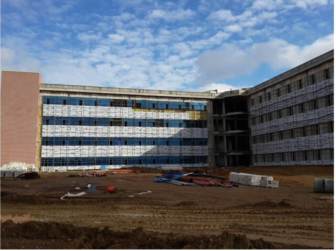
Veteriner Fakültesi 2. Kısım