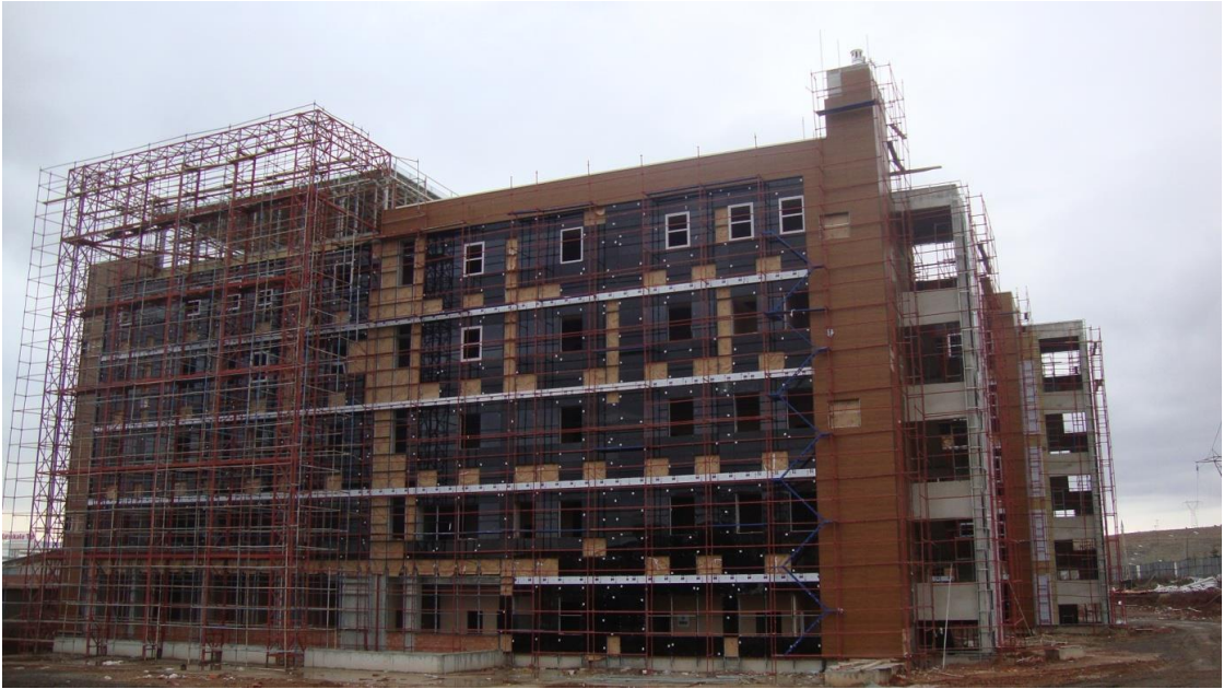
Dış Hekimliği Fakültesi