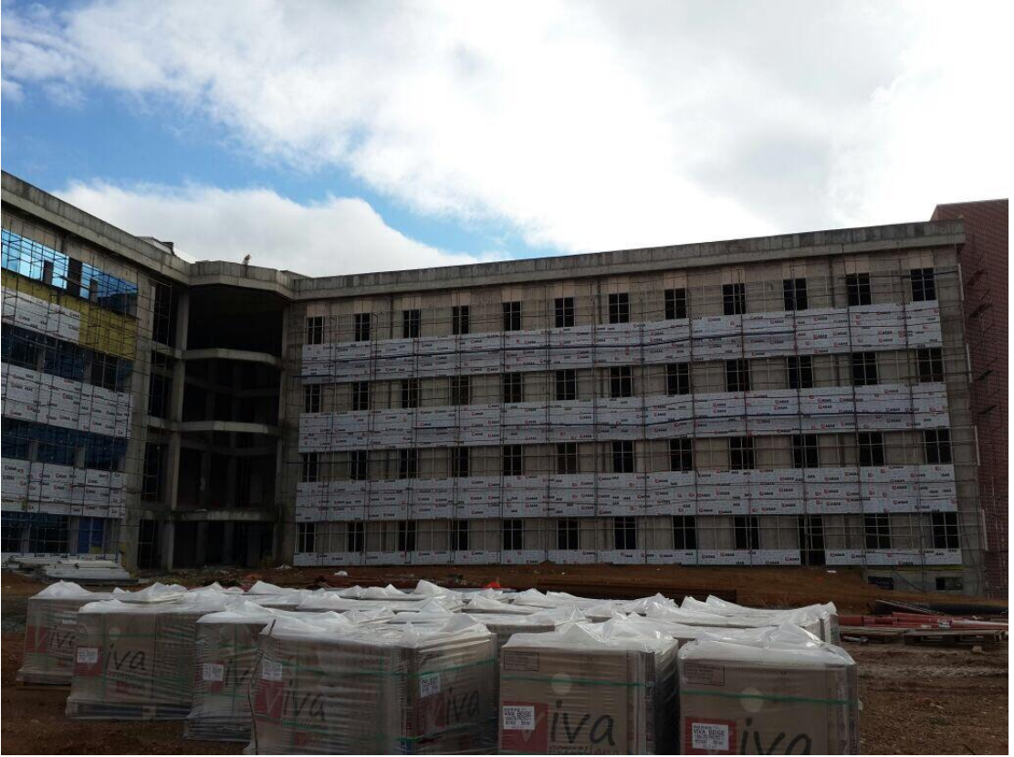
Veteriner Fakültesi 2. Kısım